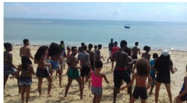
Ensaio de dança em espaço aberto

Die Fußballschule priorisierte die Milchzahnguppe (12 bis 14 Jahre) mit ihren ca. 40 Teilnehmern, die sich immer montags und mittwochs zum Trainieren traf, um ihre Fähigkeiten zu verbessern. Außerdem nahmen sie an Freundschaftsspielen und kleinen Turnieren teil und förderten damit die Aktivitäten in der Sportgemeinde.