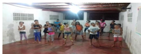
Dança - Grupo Kids de dança / Dias de ensaio

Die Fußballschule priorisierte die Milchzahnguppe (12 bis 14 Jahre) mit ihren ca. 40 Teilnehmern, die sich immer montags und mittwochs zum Trainieren traf, um ihre Fähigkeiten zu verbessern. Außerdem nahmen sie an Freundschaftsspielen und kleinen Turnieren teil und förderten damit die Aktivitäten in der Sportgemeinde.