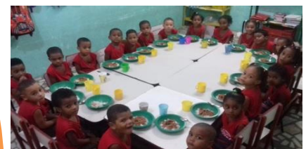
Hora do almoço - Alimentação Nutritiva e saborosa

Beim Angebot der Kindererziehung haben wir eine weitere Klasse eröffnet, womit sich die Teilnahme von Kindern zwischen 03 und 06 Jahren von 60 auf 80 eingeschriebenen Kindern erhöht und somit auch mehr Familien mit niedrigem Einkommen dazugehören. Voll unterstützt in ihren Grundbedürfnissen, wie persönliche Hygiene, tägliche Nahrung und psychologische und affektive Pflege, die bessere Bedingungen für ihr Lernen gewährleisten, werden damit 47 Kinder.