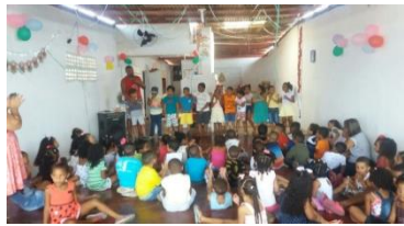
Festa de Encerramento das crianças 2017