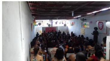
Sábado cultural "1ª Amostra de dança"